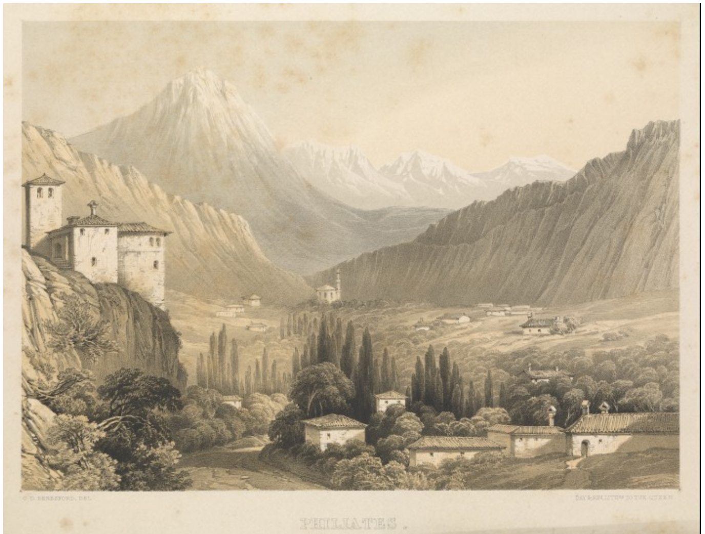
– Οι Φιλιάτες Θεσπρωτίας σε λιθογραφία του 1855.

Οι γνωστές μέχρι σήμερα ιστορικές πηγές δεν μας επιτρέπουν να καθορίσουμε ούτε την εποχή ίδρυσης των Φιλιατών, ούτε τη στιγμή κατά την οποία μετατράπηκαν σε διοικητικό κέντρο της περιφέρειας που εκτείνεται στη δεξιά όχθη του ποταμού Καλαμά, γνωστή με την ονομασία «Παρακάλαμος».