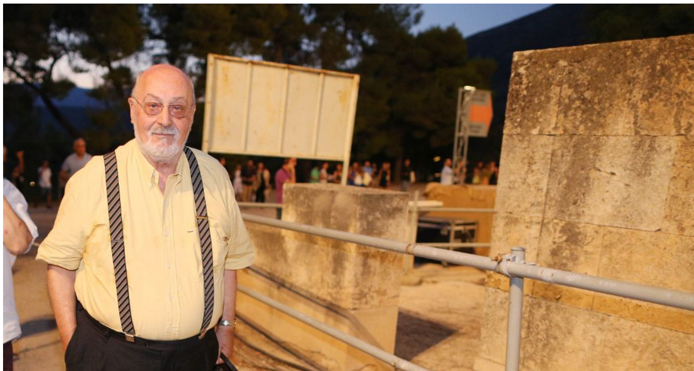
Ο Κώστας Γεωργουσόπουλος στην Επίδαυρο

Ο Κώστας Γεωργουσόπουλος είναι το συνώνυμο του ελληνικού θεάτρου. Το 1951 είδε για πρώτη φορά παράσταση, τον Μάνο Κατράκη στον «Προμηθέα Δεσμώτη», στους Δελφούς. Τρία χρόνια μετά κατέβηκε για πρώτη φορά στην Επίδαυρο.