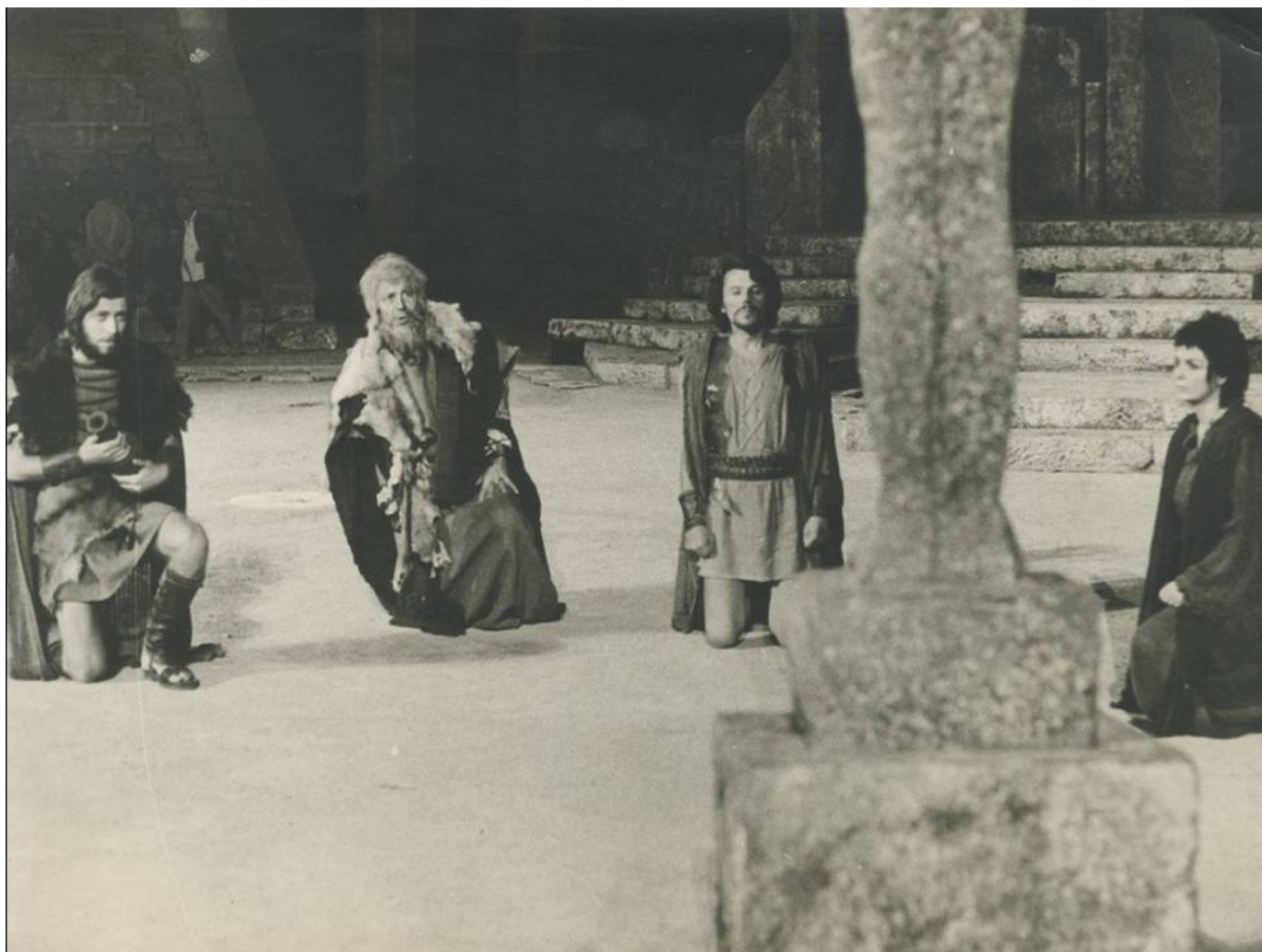
Επίδαυρος 1972 Ηλέκτρα. Σκηνοθεσία Σπύρος Ευαγγελάτος

«Η Επίδαυρος έχει τα μυστικά της. Ο Ροντήρης, ο Αλέξης Σολομός, τα ήξεραν και γι' αυτό χρησιμοποιούσαν ειδικά εργαλεία. Κακά τα ψέμματα μόνον αν είσαι ειδικευμένος σ' αυτόν τον χώρο πετυχαίνεις. Γι' αυτό και καταρρέουν καριέρες.