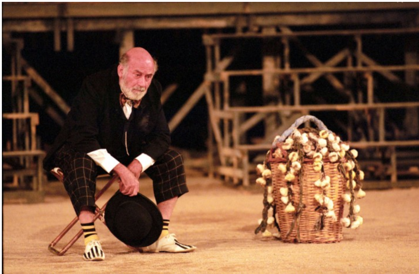
Ο Θανάσης Βέγγος - Αχαρνής του Αριστοφάνη

Όταν μου έχει γίνει πρόταση το Πάσχα να μεταφράσω κωμωδία για το καλοκαίρι, καταλαβαίνετε τι θα πει... Εγώ είπα όχι, αλλά κάποιος άλλος είπε ναι. Στον Αριστοφάνη οι παραστάσεις βασίζονται στον ηθοποιό. Αλλά απαιτούν σκηνοθέτη. Το καλύτερο που έχει να κάνει ο Τσιάνος, κι αυτό το λέω δημοσίως, είναι να μην μεταφράζει. Γιατί δεν το κατέχει και διασκευάζει μεταφράσεις άλλων».