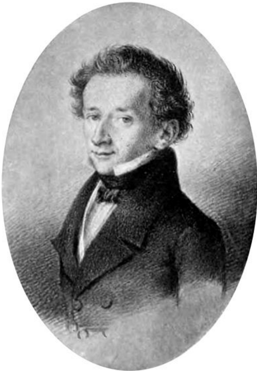
Ο κόμης Giacomo Leopardi

γεννήθηκε στο Recanati της Ιταλίας το 1798 και πέθανε στην Νάπολη το 1837.